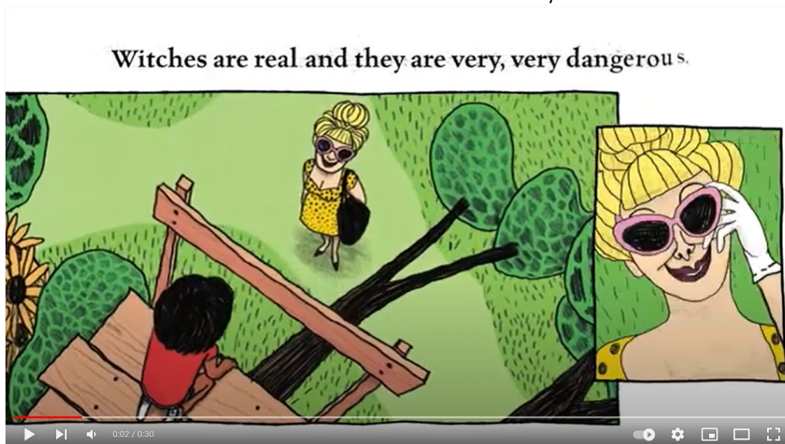
Den officielle booktrailer