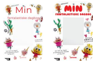
To versioner af dagbogsskabeloner

Alt om mig: Vis siden "alt om mig" til dine elever igen. Sammen med deres sidemakker kan de skiftevis fortælle om sig selv ud fra punkterne på siden.