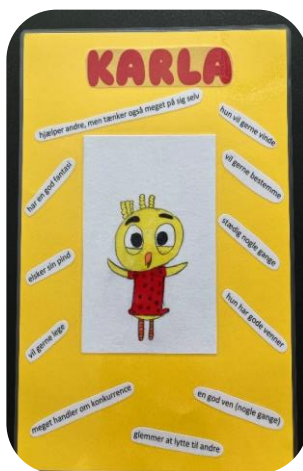
Personkarakteristik af Karla

Lad eleverne lave små tegninger af Karla (eller en af de andre karakterer fra det fantastiske univers). Klip tegningen ud, og lim den på et stykke gult papir/karton. Rundt om tegningen skriver eleverne ord og små sætninger, der passer til Karla. Den skriftlige del kan også laves fælles på klassen, hvor eleverne kommer med deres ord og sætninger, som læreren skriver ned, så alle elever har hjælpesætninger til deres skriftlige arbejde.