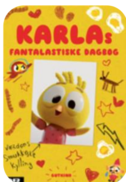
Karlas fantastiske dagbog