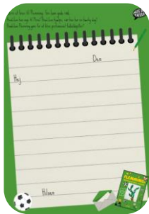
Skriveoplæg: Et brev til Flemming

I kan også arbejde fælles om et bestemt skriveoplæg, hvis du læser en af dagbøgerne for hele klassen. Det kunne fx være "Flemmings fantastiske dagbog". I oplægget skal I skrive et brev til Flemming. Hvilke gode råd vil I give Flemming? Lad eleverne drøfte de gode råd i makkerpar, inden de skrives på tavlen. Vis, hvordan et brev bygges op med modtager og afsender og brug hjælpesætningerne på tavlen som støtte til at formulere en tekst i fællesskab.