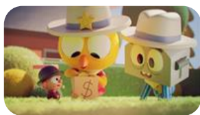
TV-afsnit Det Vilde Vesten