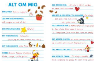
Alt om mig (uddrag fra dagbogen)

Alt om mig: Vis siden "alt om mig" til dine elever igen. Sammen med deres sidemakker kan de skiftevis fortælle om sig selv ud fra punkterne på siden.