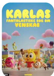
Karlas fantastiske bog om venskab