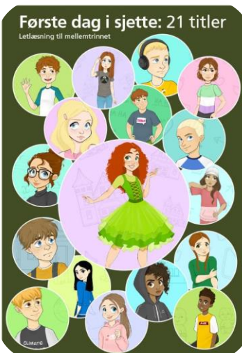
Hver bog repræsenterer én person i universet.

Denne vejledning er bygget op af tre hoveddele. Den første handler om, at eleverne får styr på den enkelte bog gennem arbejdet med personplakater . Den anden del lægger op til, at eleverne trækker tråde fra bog til bog, mens de laver en fælles universvæg . Endelig kan eleverne skrive små manuskripter af centrale scener og dramatisere dem for hinanden.