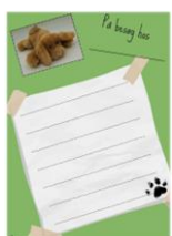
Et lille skriv fra hundebamsen