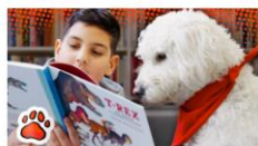
Ollie og resten af HundeBanden kan inspirere til at skabe tryktere rammer for læsning