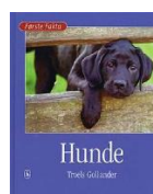
Hunde (Første Fakta) Lix-tal 10