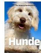
Hunde (Maxi) Lix-tal 16