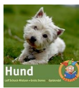
Hund (Fagfilur) LET-tal 14

I kan herefter sætte fokus på sprog i din klasse ved at inddrage plakaten "Hundesnak" og fremhæve, hvordan eleverne selv kan tale til hundebamserne under oplæsning. Der er 15 hundebamser i læsekassen, hvilket lægger op til læsning i makkerpar – første gang gerne med forskellige lette bøger, du har med til klassen. Efterfølgende vil det være oplagt at introducere eleverne for hundelæsestrategiplakaterne og fordele de tre hundefagbøger med forskellige sværhedsgrader: