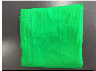
Grønt lærred (3x6m.)